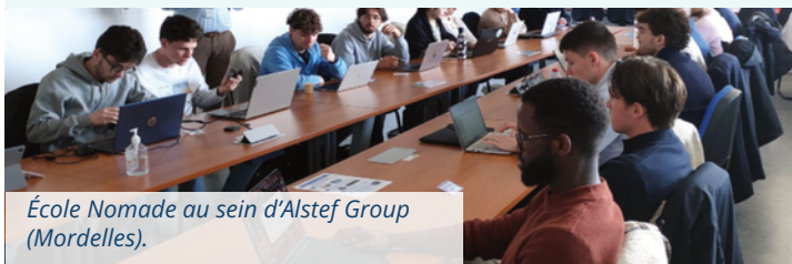
École Nomade au sein d'Alstef Group (Mordelles).